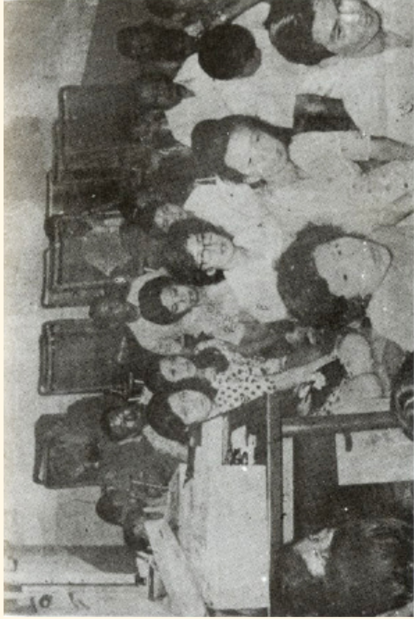
ส่วนหนึ่งของผู้เข้าชมนิทรรศการการติดต่อทางวิญญาณ เมื่อคืนวันมาฆบูชาที่ ๒๘ กุมภาพันธ์ ๒๕๑๕ (ดูหน้า ๑๑๒)